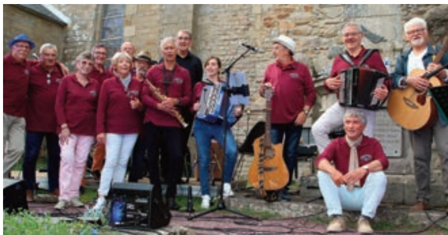
Le groupe "les refrains de Galerne" se produira le samedi 14 au stade de Kercado de 17 h 45 à 18 h 45