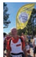
L'équipe Guéguin Picaud présente sur Auray-Vannes

"Nous souhaitons un très Joyeux Anniversaire à l'ensemble de l'équipe du Semi-Marathon et aux coureurs. Partenaire depuis les débuts, déjà 50 ans..., Vive le Sport et ses valeurs, le temps est passé sans s'en apercevoir. Bonne continuation à tous"