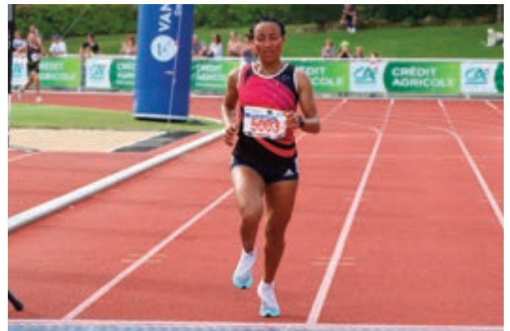
L'Ethiopienne Mékonnen en 1 h 16' 17.

Un grand merci aux 800 bénévoles qui oeuvrent à l'organisation ainsi qu'a nos partenaires institutionnels ou économiques qui nous soutiennent. Sans eux, Auray-Vannes n'existerait pas. Les Comités des Fêtes de Pluneret - Le Bono - Baden - Le Moustoir-Arradon - Ploeren - Plougoumelen, l'US Arradon Athlétisme et Le Botquelen participent également activement à l'organisation.